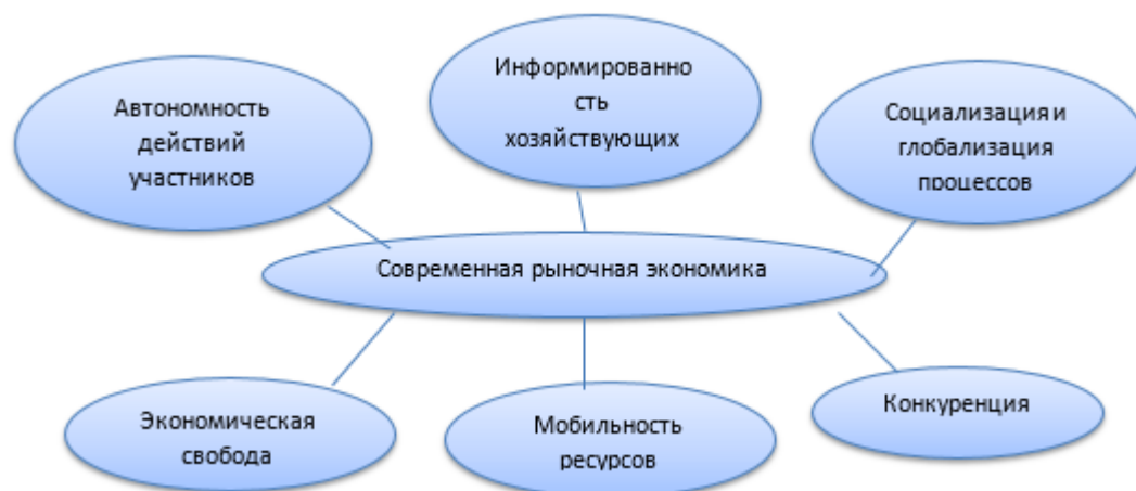
Рис 1.3. Черты рыночной экономики

На основе данных принципов можно выделить характерные черты рыночной экономики, которые отображены на рисунке 1.3.