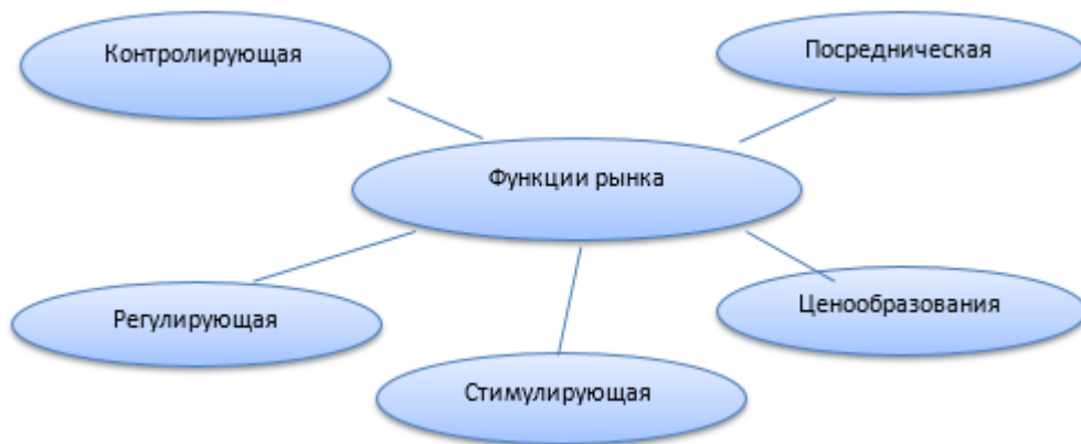
Рис 1.1 Функции рынка

Как можно заметить из данного рисунка, к функциям рынка принято относить: