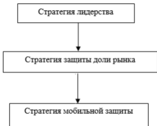
Рис 3.1. Стратегия лидерства РПО «МТС»

Следовательно, компании необходимо перенести свое внимание с конкретного продукта на потребности, которые удовлетворяют данный класс товаров в целом, вести научноисследовательские работы для анализа этих потребностей.